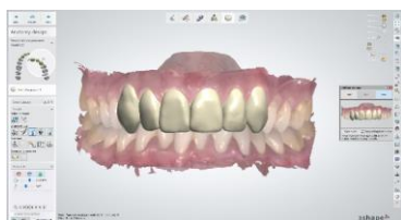
Fig 3: Los usuarios del software de laboratorio de 3Shape preparan sus negocios para el futuro uniéndose a la revolución digital en odontología. Los laboratorios dentales que usen 3Shape pueden ahora comunicarse con más facilidad e intercambiar datos con sus clientes usando Primescan de Dentsply Sirona.